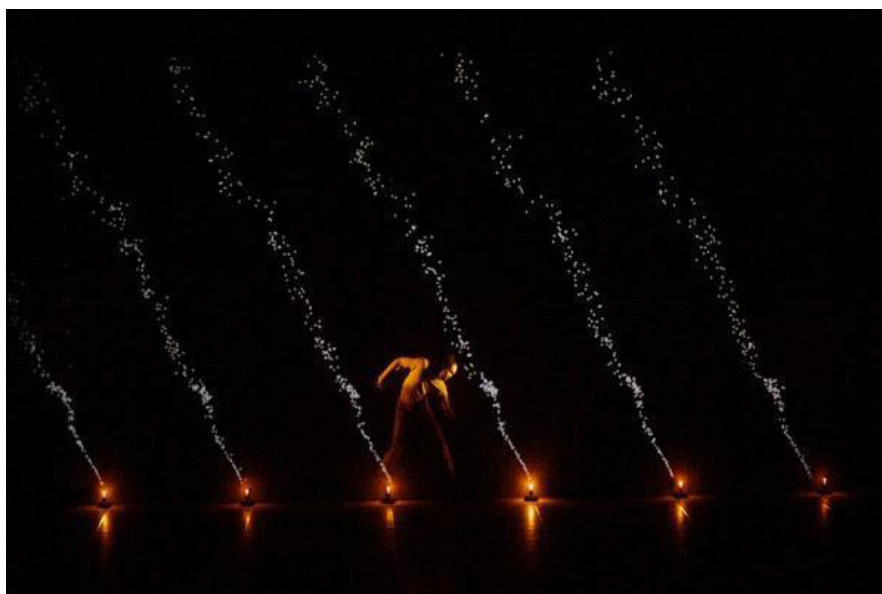
Figura 1. Pixel.