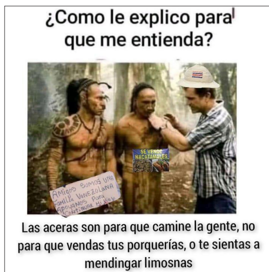
Figura 1. Meme 1