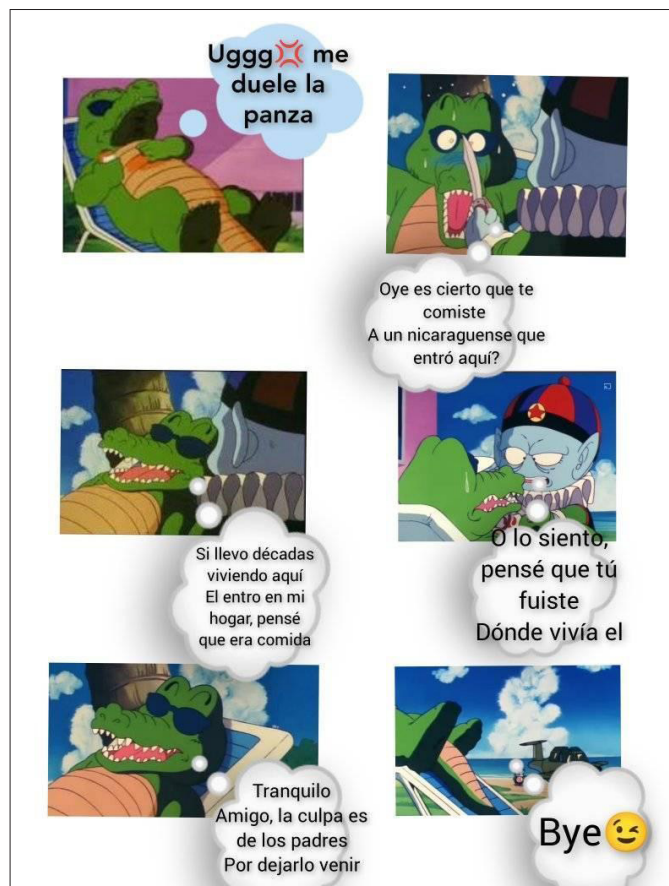
Figura 5. Meme 5