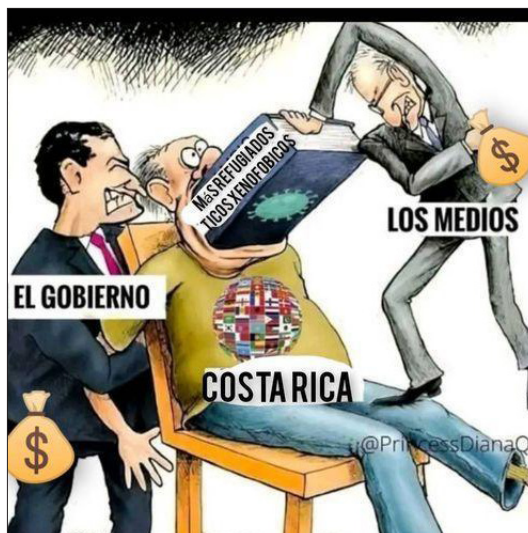
Figura 2. Meme 2