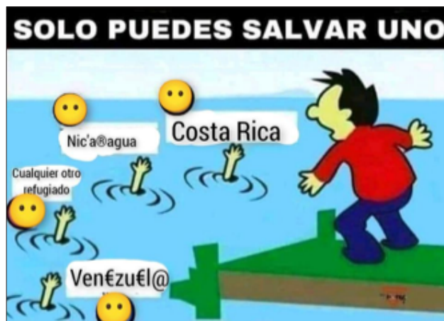
Figura 3. Meme 3