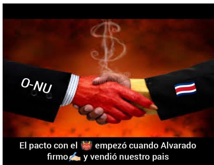
Figura 6. Meme 6